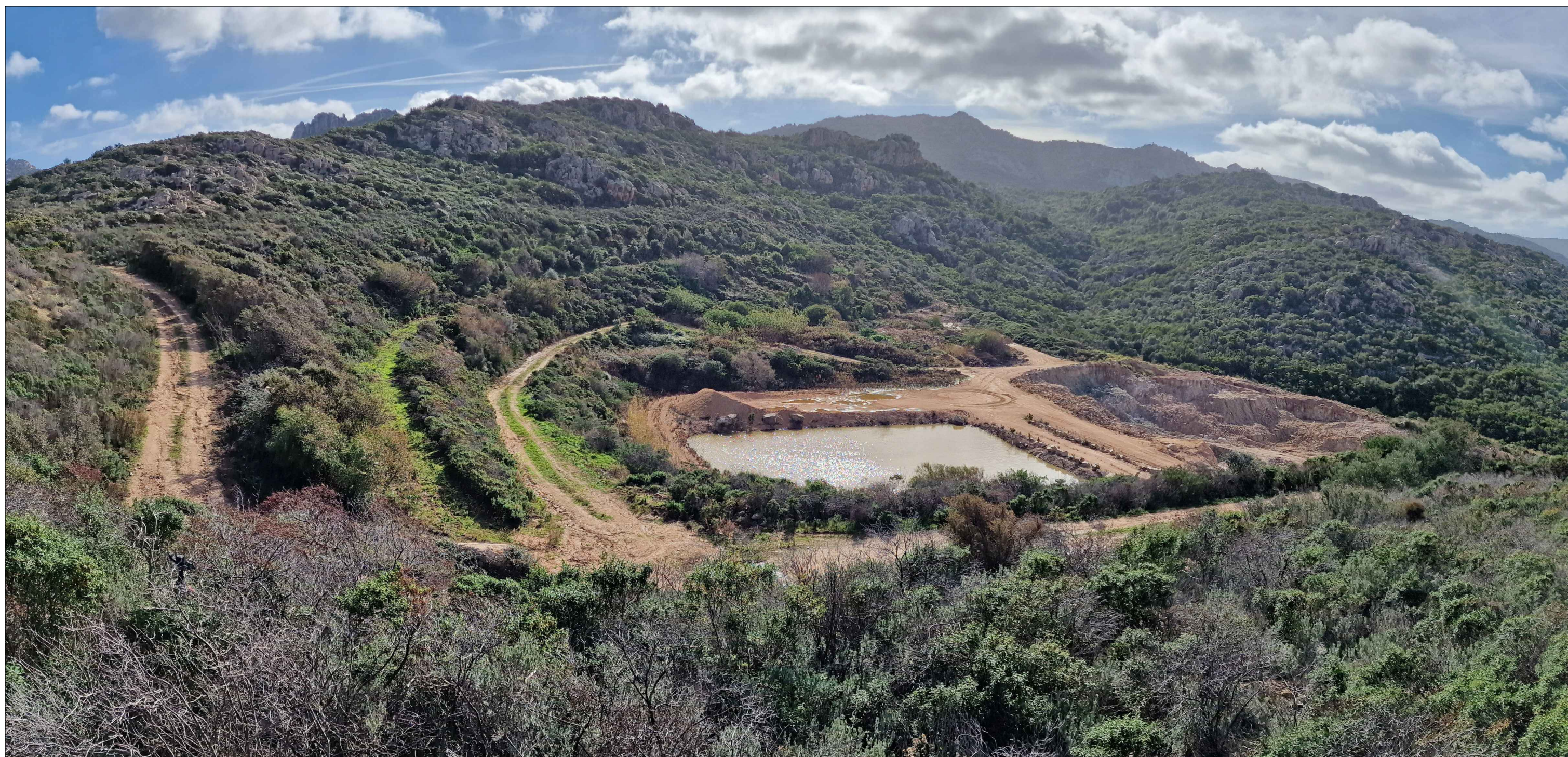
PUNTO DI VISTA P.V.3