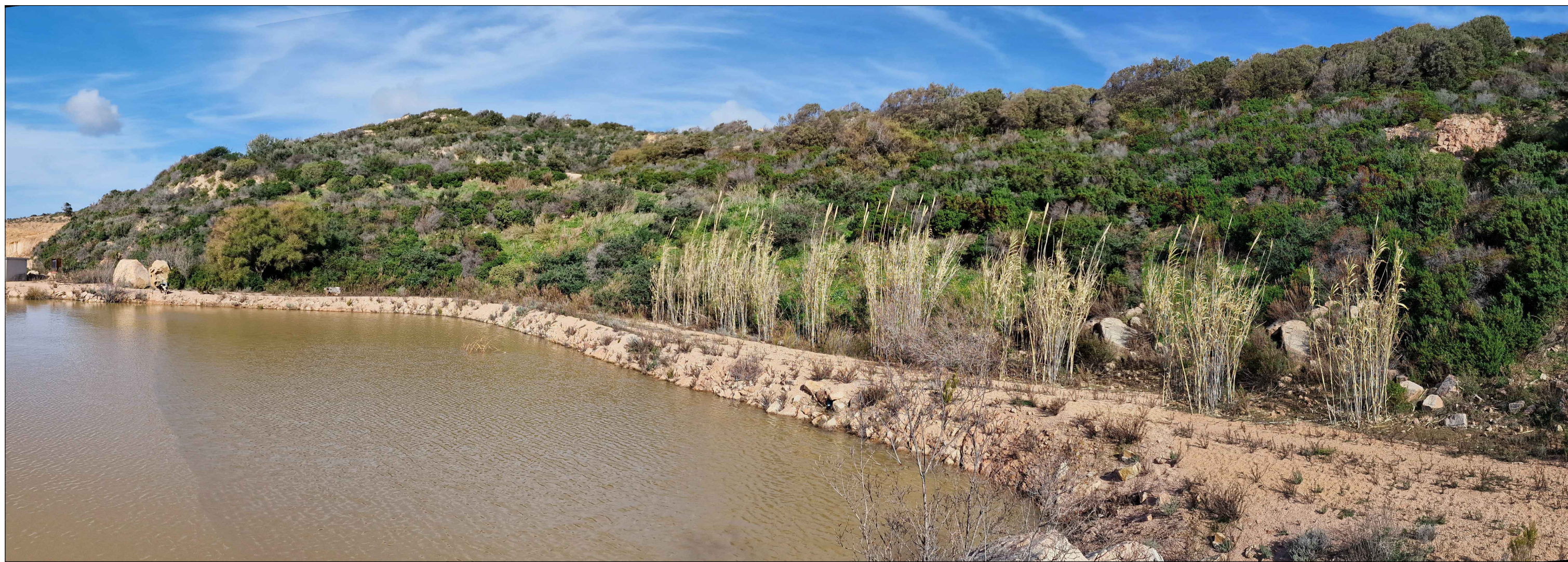
PUNTO DI VISTA P.V.1