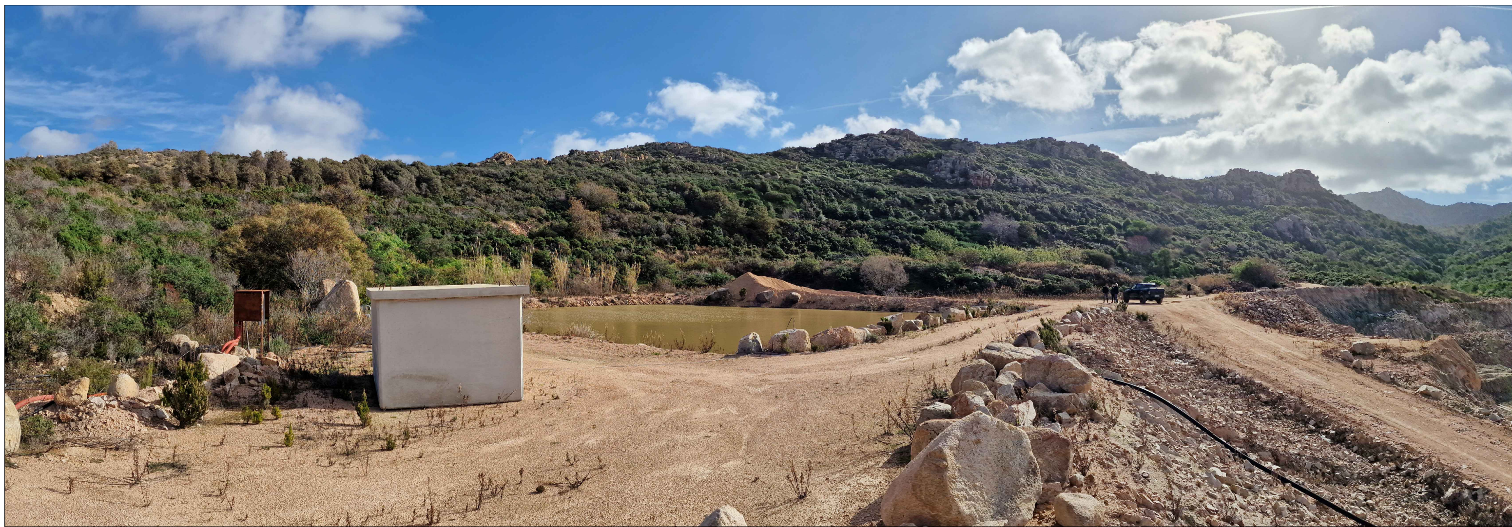
PUNTO DI VISTA P.V.2