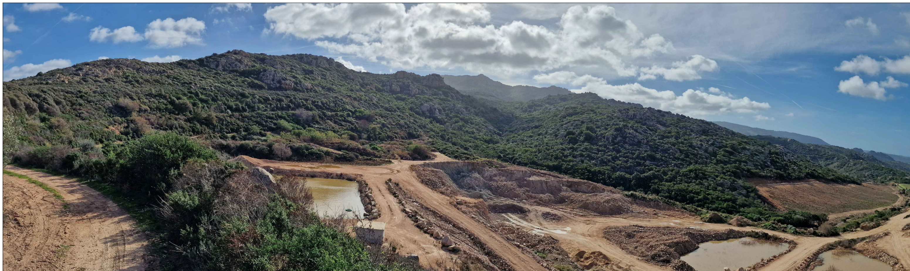
PUNTO DI VISTA P.V.4